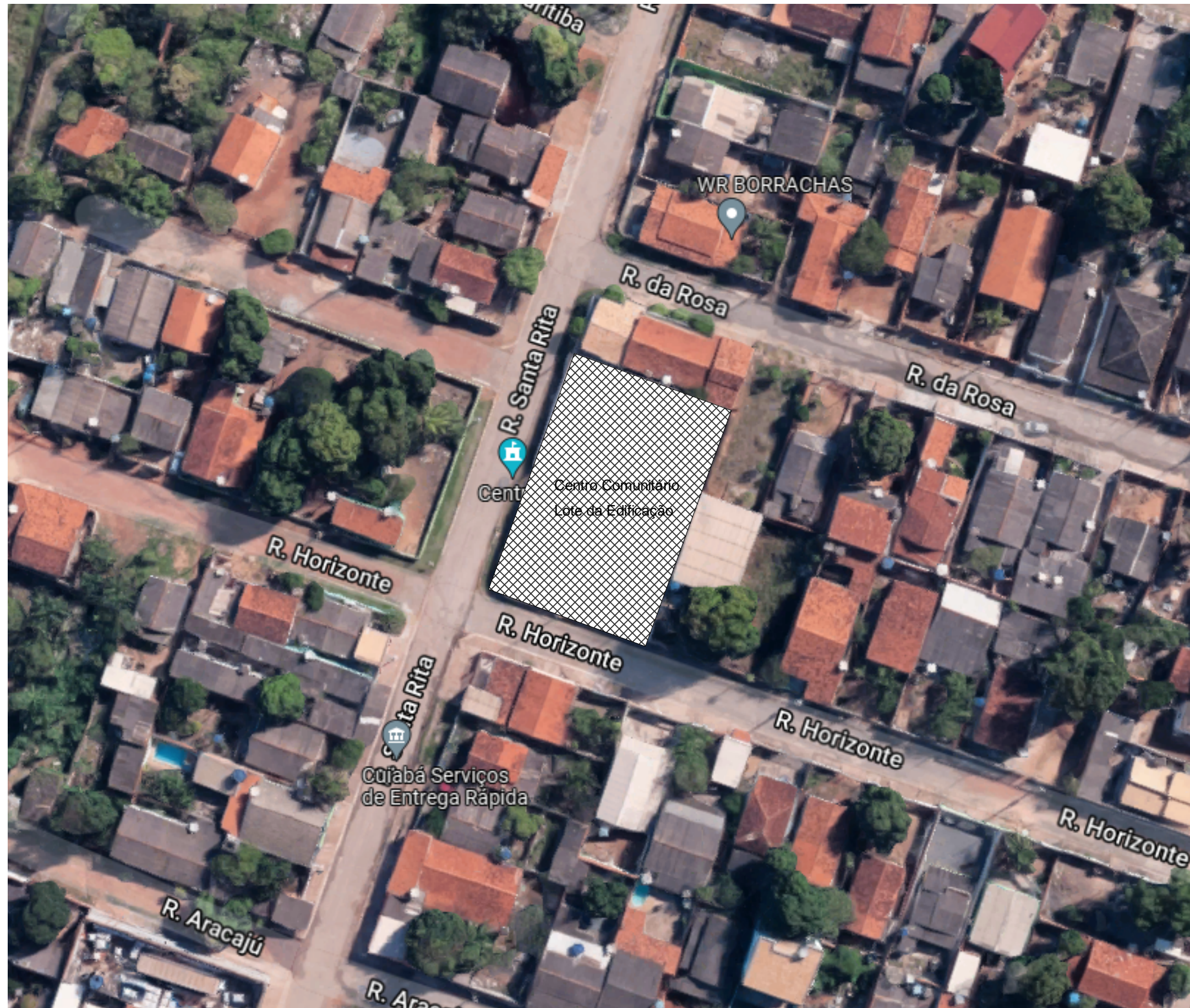
2 Imagem da Situação Satélite 1 : 100